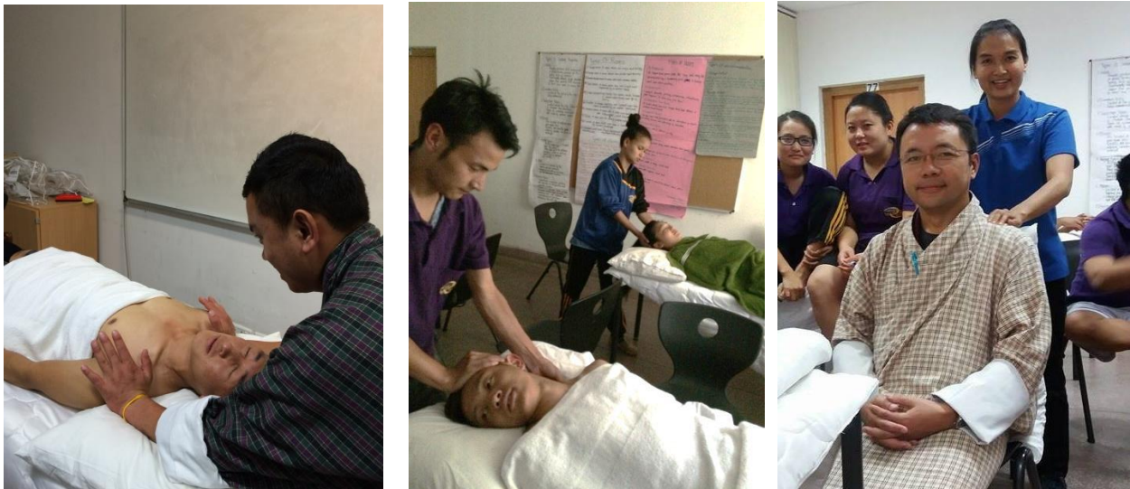
Figures: Neck, shoulder and seated massage practical in class

5. Work assignment seated massage for RITH staff to obtain feedback.