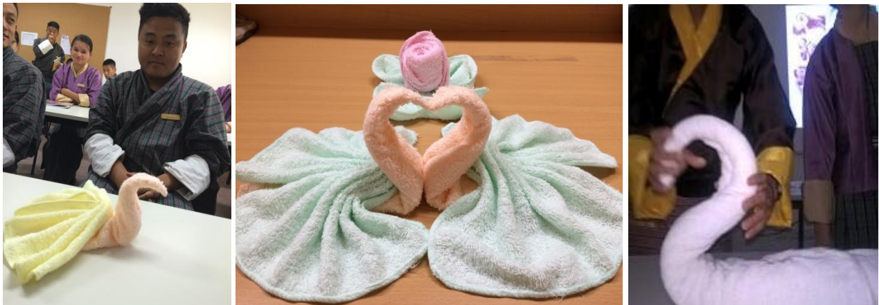
Figures: Learning how to fold towel for spa room.