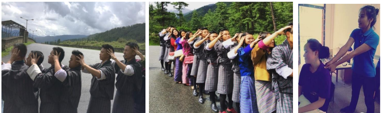
Figures: Acupressure points practical in class