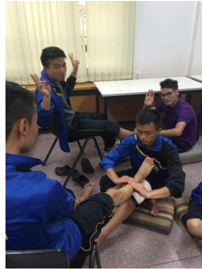
Figures: Foot massage practical in class