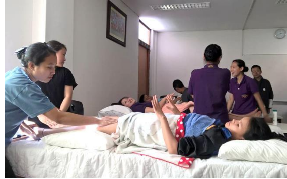
Figures: Leg massage practical in class