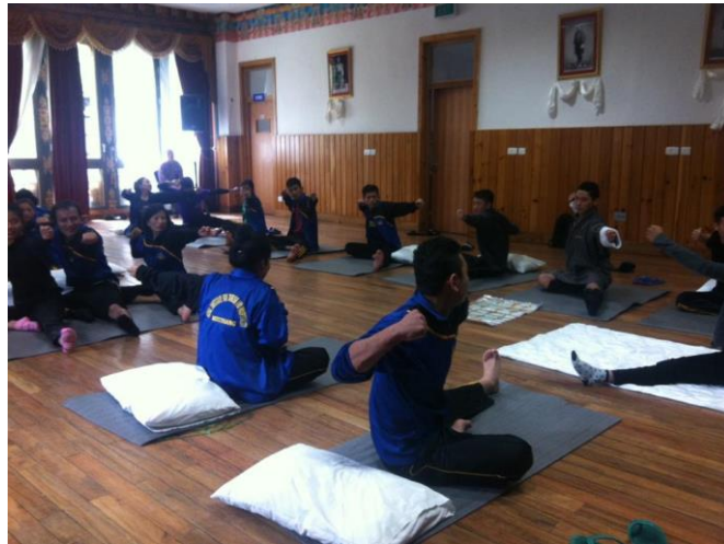
Figure: Thai hermit exercise