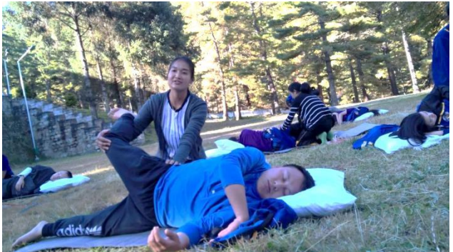
Figures: Thai massage practical and stretching