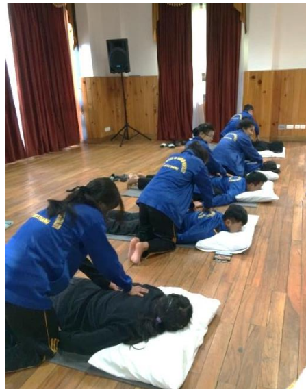
Figures: Practical examination