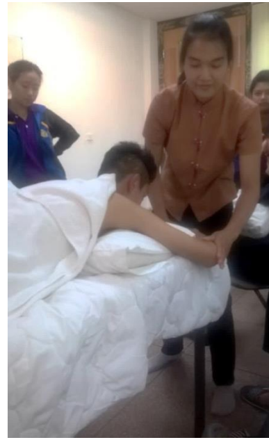
Figures: Back massage practical in class