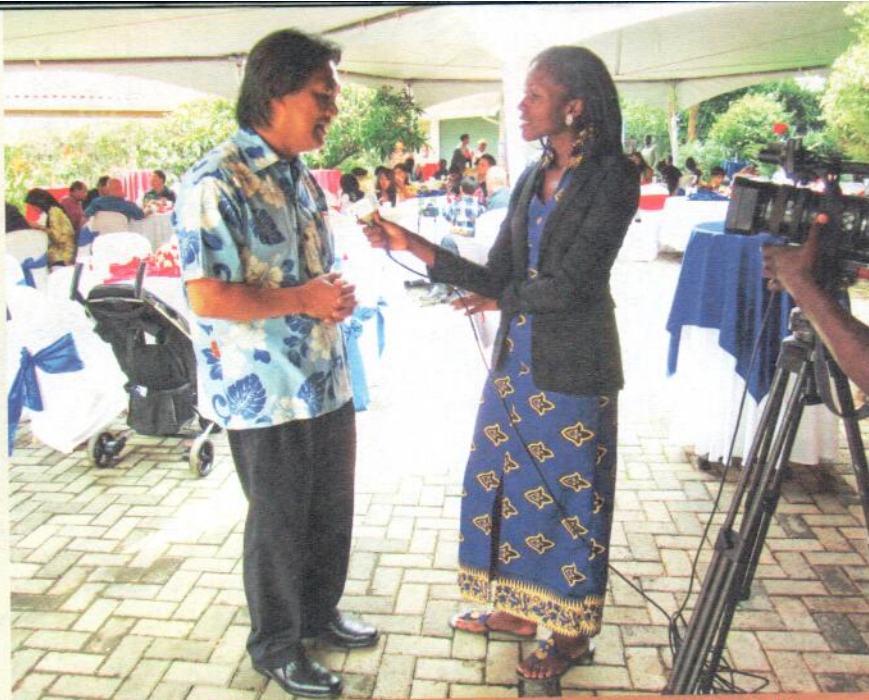
ท่านเอกอัครราชทูตอหิพร บุญประคอง เอกอัครราชทูตไทย ณ กรุงไนโรบี ให้สัมภาษณ์กับ citizen tv krub ของเคนยาถึงการจัดงานในครั้งนี้ ที่ทำเนียบเอกอัครราชทูตฯ