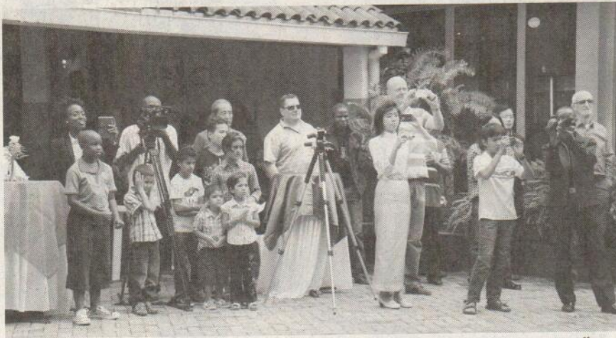
มีสื่อจาก น.ส.พ. the star และ citizen tv krub ของเคนยาสนใจมาทำข่าวงานนี้ด้วย

ศิลปศึกษา สาขาดนตรีคีตศิลป์ เครื่องมือ ระนาดทุ้ม