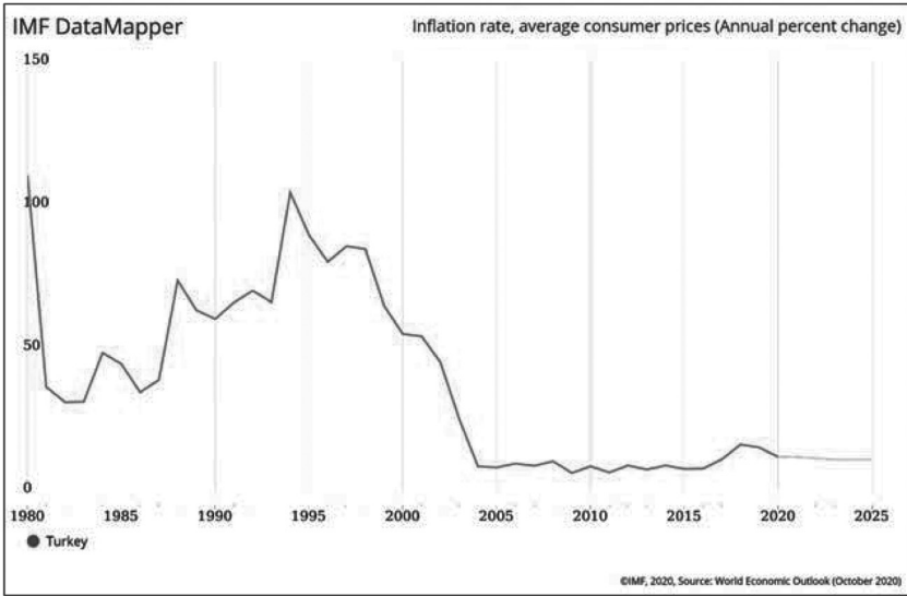
กราฟที่ 2 : อัตราเงินเฟ้อ, ดัชนีราคาผู้บริโภคต่อปีของประเทศตุรกี ระหว่างปี ค.ศ. 1980-2025 44

รัฐบาลตุรกีได้มีความพยายามในการลดอัตราเงินเฟ้อและสร้างเสถียรภาพทางเศรษฐกิจอย่างยั่งยืนด้วยการจัดทำแผนงาน New Economy Program 2021-2023 ภายใต้แนวคิด New Balancing, New Normal, New Economy โดยรัฐบาลคาดการณ์ว่าอัตราเงินเฟ้อที่คาดการณ์ไว้ว่าจะจะเป็น 8% ในสิ้นปี ค.ศ. 2021 จะลดลงเหลือ 4.9% เมื่อจบแผนงาน โดยรัฐบาลมีความตั้งใจจะลดอัตราเงินเฟ้อให้เหลือเพียงเลขตัวเดียวเพื่อราคาที่มีเสถียรภาพ ส่วนอัตราการว่างงานที่จะแตะตัวเลข 13.8% ในปีนี้ และลดลงเหลือ 12.9% และ 10.9% ในปีถัดไป อีกทั้งรัฐบาลยังให้คำมั่นว่าจะฟื้นฟูตลาดแรงงานหลังการแพร่ระบาดของโควิด 45