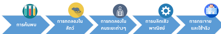
ภาพที่ 4 ห่วงโซ่คุณค่า (value chain) ของอุตสาหกรรมการแพทย์และสุขภาพ

อย่างไรก็ตาม ความท้าทายสำคัญของการพัฒนาเศรษฐกิจ BCG ด้านการแพทย์และสุขภาพให้สามารถทำรายได้ให้แก่ประเทศไทยได้อย่างแท้จริงคือ การเชื่อมโยงให้เกิดห่วงโซ่คุณค่า (value chain) ของอุตสาหกรรม ทั้งที่มีอยู่ในประเทศไทยและที่อยู่ในต่างประเทศให้เชื่อมต่อกันอย่างครบถ้วน โดยความท้าทายประการหนึ่งคือการลดการนำเข้ายารักษาโรค โดยเฉพาะยาชีววัตถุคล้ายคลึง (biosimilar) ซึ่งจำนวนมากเป็นยารักษาโรคไม่ติดต่อเรื้อรังต่างๆ ที่พบในผู้สูงอายุ และการลดการนำเข้าอุปกรณ์ทางการแพทย์