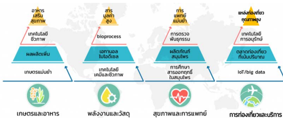
ภาพที่ 1 แนวคิดในการสร้างมูลค่าเพิ่มของเศรษฐกิจ BCG

ภาพที่ 1 สรุปแนวคิดในการสร้างมูลค่าเพิ่มของเศรษฐกิจ BCG ในทั้ง 4 สาขาย่อย ทั้งนี้การพัฒนาเศรษฐกิจ BCG จะมีความสำคัญต่อประเทศสูงทั้งในมิติด้านสังคม เศรษฐกิจและสิ่งแวดล้อม โดยเกี่ยวข้องกับการจ้างงานมากถึงครึ่งหนึ่งของจำนวนการจ้างงานรวม มีมูลค่าเพิ่มทางเศรษฐกิจรวมกัน 3.4 ล้านล้านบาท คิดเป็นร้อยละ 21 ของผลิตภัณฑ์มวลรวมในประเทศ (GDP) ใน 4 สาขา คือ เกษตรและอาหาร สุขภาพและการแพทย์ พลังงาน วัสดุและเคมีชีวภาพ และการท่องเที่ยวและเศรษฐกิจสร้างสรรค์ ซึ่งมีศักยภาพในการเพิ่มมูลค่าเป็น 4.4 ล้านล้านบาทหรือคิดเป็นร้อยละ 24 ของ GDP ในอีก 5 ปีข้างหน้า (ภาพที่ 2) โดยทั้ง 4 สาขายุทธศาสตร์ดังกล่าวสามารถพัฒนาอย่างอิสระ แต่การเชื่อมโยงและพัฒนาไปพร้อมกันจะก่อให้เกิดประโยชน์สูงสุด