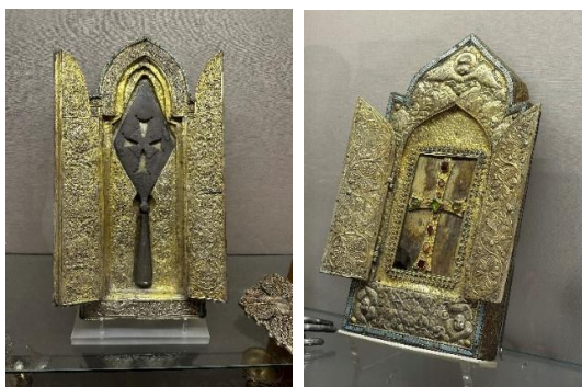
ภาพที่ 1 หอกศักดิ์สิทธิ์ ภาพที่ 2 ชิ้นส่วนเรือโนอาห์ ที่พิพิธภัณฑสถานใน Etchmiadzin

นอกจากนี้ ในคัมภีร์ไบเบิลยังระบุว่าเมื่อน้ำท่วมโลก เรือโนอาห์ (Noah's Ark) ได้ไปจอดค้างที่ภูเขาอารารัต (Ararat) โดยโนอาห์และครอบครัวได้ลงมาจากเรือ เมื่อน้ำแห้งติแล้ว ภูเขาอารารัตจึงเป็นภูเขาศักดิ์สิทธิ์ในความเชื่อของชาวอาร์เมเนีย และที่พิพิธภัณฑสถานใน Etchmiadzin จึงมีการบูชาสักการะขึ้นไม้ที่เชื่อว่าเป็นชิ้นส่วนของเรือโนอาห์ที่พบบนภูเขาอารารัตอีกด้วย