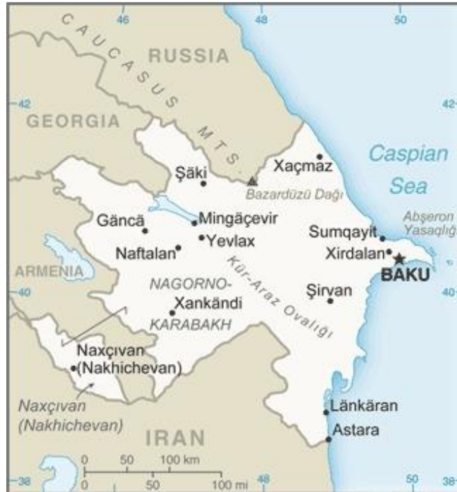
ภาพที่ 1 แผนที่ประเทศอาเซอร์ไบจาน