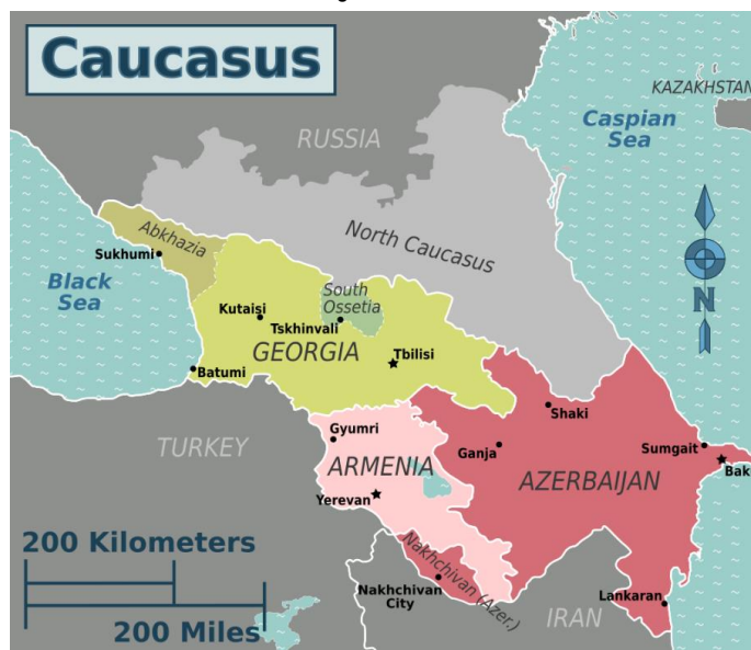
ภาพที่ 2 ภูมิภาคคอเคซัสใต้