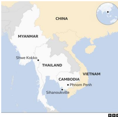
ภาพที่ 1 พื้นที่สีหนุวิลล์และชเว ก๊กโก

จากข้อมูลทั้งหมดที่เกี่ยวข้องกับแหล่งที่ตั้งหรือศูนย์อาชญากรรมออนไลน์ในกลุ่มประเทศอนุภูมิภาคุ่มแม่น้ำโขง พบว่ามีลักษณะสำคัญร่วมกัน 3 ประการคือ (1) ทุกพื้นที่จะตั้งอยู่ในเขตตะเข็บชายแดน หรือ ตั้งอยู่ในเขตเศรษฐกิจพิเศษ ซึ่งกฎหมายปกติทั่วไปของประเทศนั้น ๆ ไม่สามารถบังคับได้ (2) ทุกพื้นที่เกี่ยวข้องกับกลุ่มมาเฟียชาวจีนซึ่งลงทุนผ่านกิจการกาสิโนก่อนปรับเปลี่ยนเป็นพื้นที่ศูนย์อาชญากรรมออนไลน์หลังการแพร่ระบาดของโควิด-19 และ (3) การพัฒนาของเทคโนโลยีสารสนเทศและการเติบโตของนวัตกรรมส่งผลให้อาชญากรรมออนไลน์มีลักษณะที่ไร้ตัวตน (invisible) ไร้พรมแดน (borderless) และนิรนาม (anonymous) ผ่านเครือข่ายอินเทอร์เน็ตความเร็วสูง