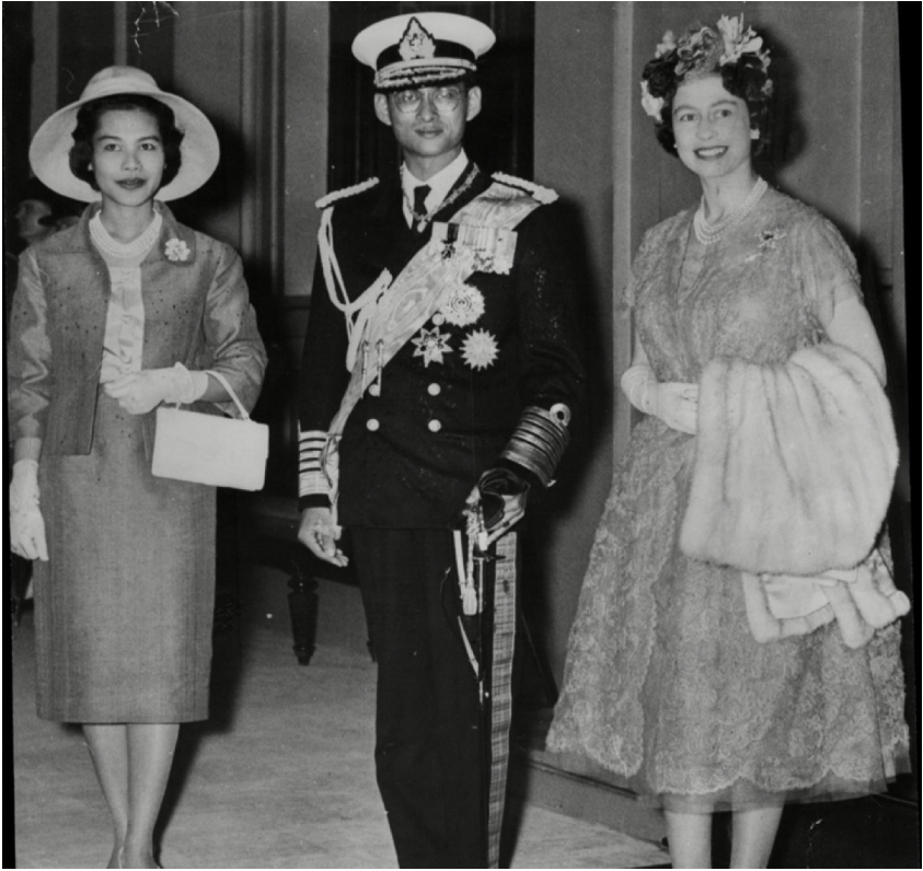
ภาพที่ 26 : พระบาทสมเด็จพระบรมชนกาธิเบศร มหาภูมิพลอดุลยเดชมหาราช บรมนาถบพิตร และ สมเด็จพระนางเจ้าสิริกิติ์ พระบรมราชินีนาถ พระบรมราชชนนีพันปีหลวง พร้อมด้วยสมเด็จพระราชินีนาถ เอลิซาเบธที่ 2 แห่งสหราชอาณาจักร ในโอกาสที่ทั้งสองพระองค์เสด็จฯ ถึงสหราชอาณาจักร วันที่ 19 กรกฎาคม พ.ศ. 2503