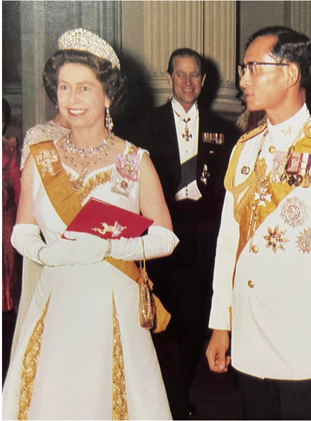
ภาพที่ 51 : พระบาทสมเด็จพระบรมชนกาธิเบศร มหาภูมิพลอดุลยเดชมหาราช บรมนาถบพิตร และ สมเด็จพระราชินีนาถเอลิซาเบธที่ 2 แห่งสหราชอาณาจักร