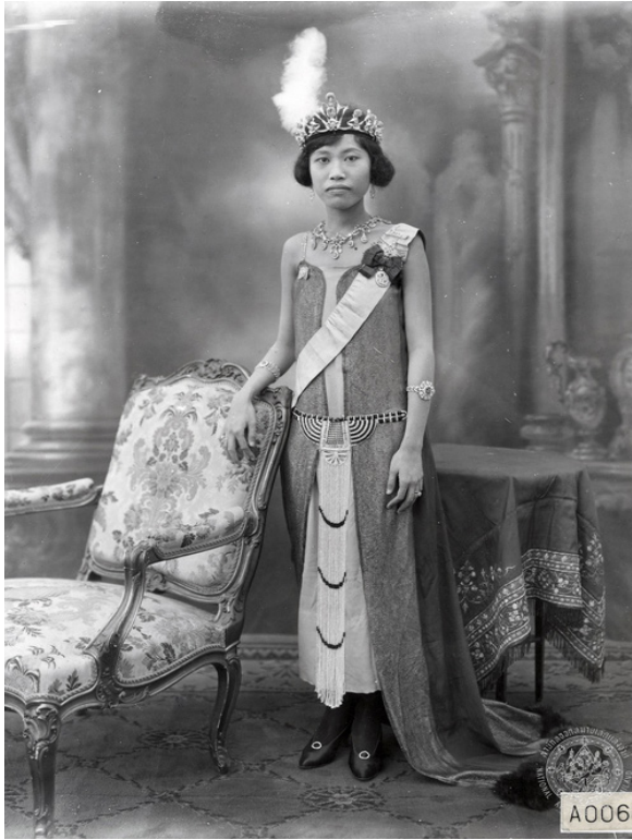
ภาพที่ 10 : พระนางเจ้าสุวัทนา พระวรราชเทวีในรัชกาลที่ 6 ทรงฉลองพระองค์ตามแบบแฟชั่นนิยมกันในช่วงแฟลปเปอร์ (Flappers) หรือยุคออลังการศิลป์ (Art Deco) ตอนต้น