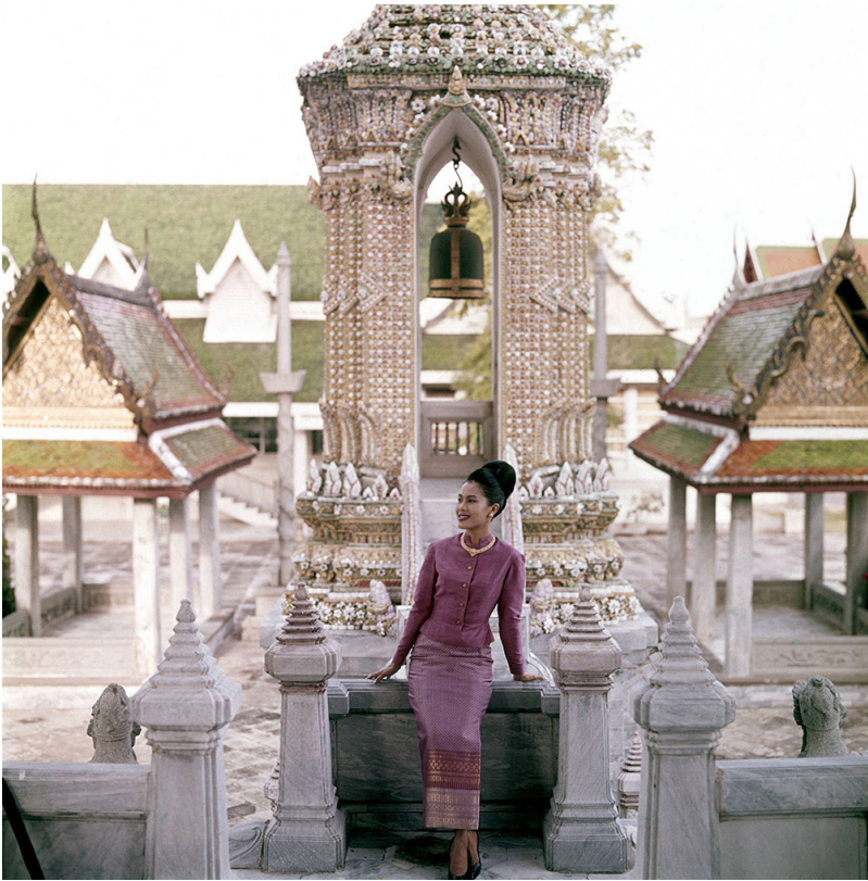
ภาพที่ 33 : สมเด็จพระนางเจ้าสิริกิติ์ พระบรมราชินีนาถ พระบรมราชชนนีพันปีหลวง ฉายโดย นาย Henry Clarke ตีพิมพ์ในวิกิฉบับกุ่มภาพันท์ พ.ศ. 2508 ที่มา : Vogue Thailand, “พระพันปีหลวงในไว้ออกอเมริกา! ย้อนชมภาพสมเด็จพระนางเจ้าสิริกิติ์ในไว้ออกเมื่อ 57 ปีที่แล้ว,” Vogue Thailand [ออนไลน์] แหล่งที่มา : https://www.vogue.co.th/fashion/article/queensirikitvogueus1962and65 [เข้าถึงเมื่อวันที่ 31 มีนาคม 2566]