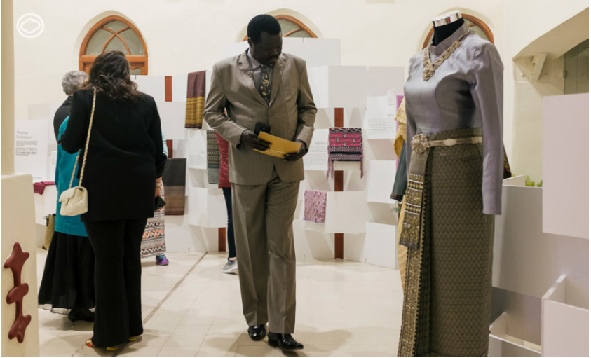
ภาพที่ 71 และ 72 : บรรยากาศในงาน THAI Textiles The Touch of Thai