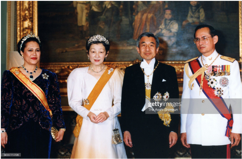
ภาพที่ 56 : สมเด็จพระนางเจ้าสิริกิติ์ พระบรมราชินีนาถ พระบรมราชชนนีพันปีหลวง และสมเด็จพระจักรพรรดินีมิจิโกะแห่งญี่ปุ่น ทรงฉลองพระองค์ชุดกระโปรงยาว ทรงเทียรา และประดับเครื่องราชอิสริยาภรณ์เต็มยศตามธรรมเนียมสากล ในโอกาสที่พระบาทสมเด็จพระบรมชนกาธิเบศร มหาภูมิพลอดุลยเดชมหาราช บรมนาถบพิตร และสมเด็จพระนางเจ้าสิริกิติ์ พระบรมราชินีนาถ พระบรมราชชนนีพันปีหลวง ถวายพระกระยาหารค่ำอย่างเป็นทางการเพื่อถวายพระเกียรติ (state banquet) แต่สมเด็จพระจักรพรรดิอากิฮิโตะ และสมเด็จพระจักรพรรดินีมิจิโกะแห่งญี่ปุ่น ในโอกาสเสด็จฯ เยือนประเทศไทยอย่างเป็นทางการ ในฐานะพระราชอาคันตุกะ ณ พระที่นั่งจักรีมหาปราสาท ในพระบรมมหาราชวัง