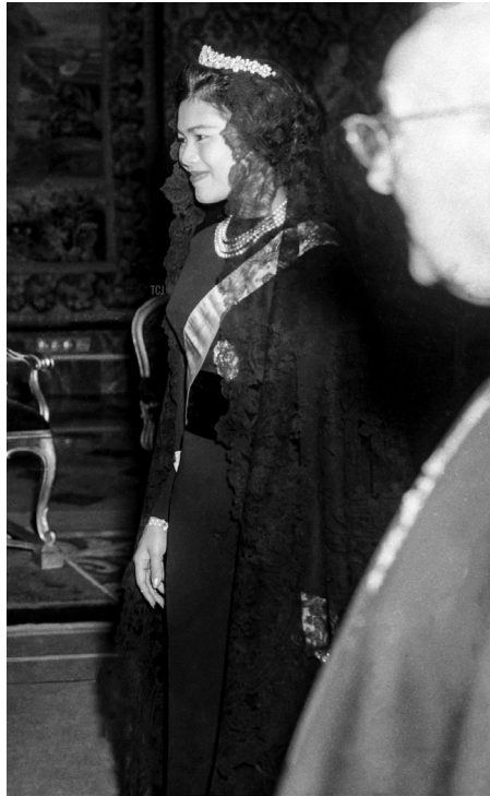
ภาพที่ 40 : สมเด็จพระนางเจ้าสิริกิติ์ พระบรมราชินีนาถ พระบรมราชชนนีพันปีหลวง ทรงฉลองพระองค์ตามธรรมเนียมการเข้าเฝ้าฯ สมเด็จพระสันตะปาปา ณ นครรัฐวาติกัน พ.ศ. 2503