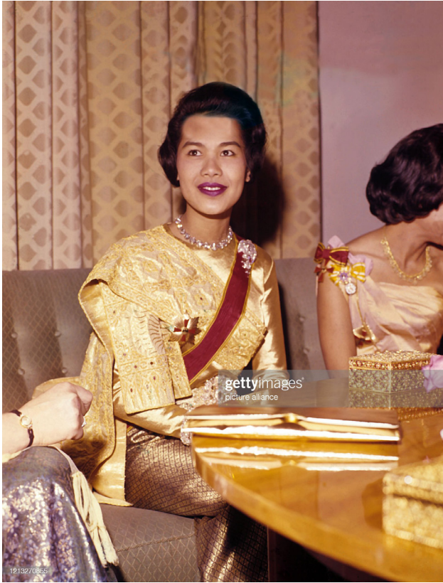
ภาพที่ 39 : สมเด็จพระนางเจ้าสิริกิติ์ พระบรมราชินีนาถ พระบรมราชชนนีพันปีหลวง ทรงฉลองพระองค์แบบชาติยราชานารีตามโบราณราชประเพณี ในการเสด็จฯ เยือนสหพันธ์สาธารณรัฐเยอรมนี พ.ศ. 2503

ประเด็นเรื่องพัสดราภรณ์กับการต่างประเทศของไทยที่น่าสนใจอย่างยิ่งอีกประเด็นหนึ่ง คือ การเสด็จเยือนรัฐวาทิกัน อันเป็นส่วนหนึ่งของการเสด็จเยือนสหรัฐอเมริกาและยุโรปอย่างเป็นทางการ พ.ศ. 2503 ในครั้งนี้ สมเด็จพระสันตะปาปาจอห์นที่ 23 ทรงส่งเจ้าหน้าที่จากวาทิกัน ประกอบไปด้วยขุนนาง 3 คน และพระสมณศักดิ์ 3 รูป พร้อมด้วยรถยนต์ 6 คันมารับเสด็จ ทั้งนี้ พระบาทสมเด็จพระบรมชนกาธิเบศร มหาภูมิพลอดุลยเดชมหาราช บรมนาถบพิตร และสมเด็จพระนางเจ้าสิริกิติ์ พระบรมราชินีนาถ พระบรมราช