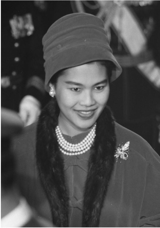
ภาพที่ 27 : สมเด็จพระนางเจ้าสิริกิติ์ พระบรมราชินีนาถ พระบรมราชชนนีพันปีหลวง ทรงฉลองพระองค์ ชุดกลางวันแบบสากล ออกแบบตัดเย็บโดยห้องเสื้อบัลแมง ทรงพระมาลาและถุงพระหัตถ์ตามธรรมเนียมสากล ในโอกาสเสด็จฯ เยือนราชอาณาจักรเนเธอร์แลนด์อย่างเป็นทางการ พ.ศ. 2503