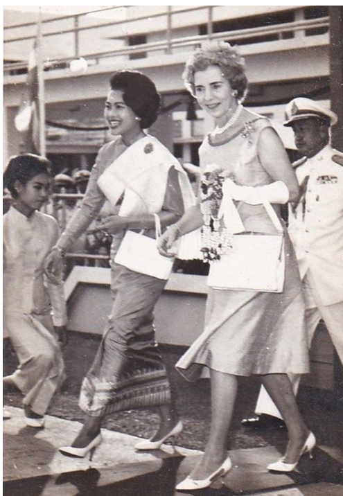
ภาพที่ 42 : สมเด็จพระนางเจ้าสิริกิติ์ พระบรมราชินีนาถ พระบรมราชชนนีพันปีหลวง พร้อมด้วยสมเด็จพระราชินีอิงกริดแห่งเดนมาร์ก เมื่อครั้งเสด็จฯ เยือนประเทศไทย พ.ศ. 2505 จากภาพ สมเด็จพระราชินีอิงกริดทรงอุ้มพระหัตถ์ซ้ายข้างเดียว และทรงถืออุ้มพระหัตถ์ขวาไว้ที่พระหัตถ์ซ้าย

ธรรมเนียมการสวมถุงมือนี้ กลุ่มประเทศสแกนดิเนเวียยังคงถือธรรมเนียมโบราณกันอยู่ โดยในงานที่เป็นทางการ สุภาพสตรีมักสวมหมวกและถุงมืออย่างประเทศอื่น ๆ ในยุโรป แต่นิยมสวมถุงมือข้างซ้ายเพียงข้างเดียว เพราะถ้าจะสัมผัสมือกับผู้ใด ควรจะถอดถุงมือขวาออกเสียก่อนให้มือต่อมือสัมผัสกันเพื่อเป็นการอ่อนน้อมเข้าหากัน ทั้งนี้ ถุงพระหัตถ์เป็นส่วนหนึ่งของฉลองพระองค์แบบสากล ซึ่งสมเด็จพระบรมราชินีนาถ พระบรมราชชนนีพันปีหลวง ทรงใช้พร้อมกับการทรงพระมาลา ในการเสด็จเยือนสหรัฐอเมริกาและประเทศในทวีปยุโรป รวมไปถึงบางประเทศในทวีปเอเชีย เช่น ฟิลิปปินส์