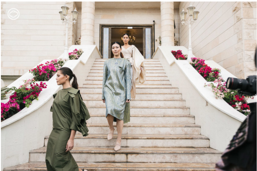
ภาพที่ 70 : บรรยากาศการเดินแฟชั่นโชว์ในงาน “THAI Textiles The Touch of Thai”

นอกจากพัฒนารากฐานของสมเด็จพระบรมราชินีนาถ พระบรมราชชนนีพันปีหลวง และพระบรมวงศานุวงศ์ที่มีส่วนสำคัญในการเจริญสัมพันธ์ไมตรีกับนานาประเทศแล้ว พัฒนารากฐานในแง่แฟชั่นและการแต่งกายยังกลายเป็นเครื่องมือหนึ่งในการดำเนินการทางการทูต ดังจะเห็นได้จากการที่กระทรวงการต่างประเทศ ร่วมกับกระทรวงวัฒนธรรม จัดโครงการ “THAI Textiles The Touch of Thai” เป็นโครงการเผยแพร่ศิลปวัฒนธรรมไทยในต่างประเทศโดยใช้ผ้าไทยเป็นแกนหลัก มีทั้งนิทรรศการผ้าไทยและชุดไทยประเพณี แบบต่าง ๆ ที่งดงาม และยังมีการแสดงนาฏศิลป์ ของที่ระลึกจากพิพิธภัณฑ์ผ้าในสมเด็จพระนางเจ้าสิริกิติ์ พระบรมราชินีนาถ และการแสดงแบบเสื้อผ้าที่ออกแบบตัดเย็บจากผ้าไทย เป็นคอลเลกชันรวมผลงานจากนักออกแบบชาวไทย