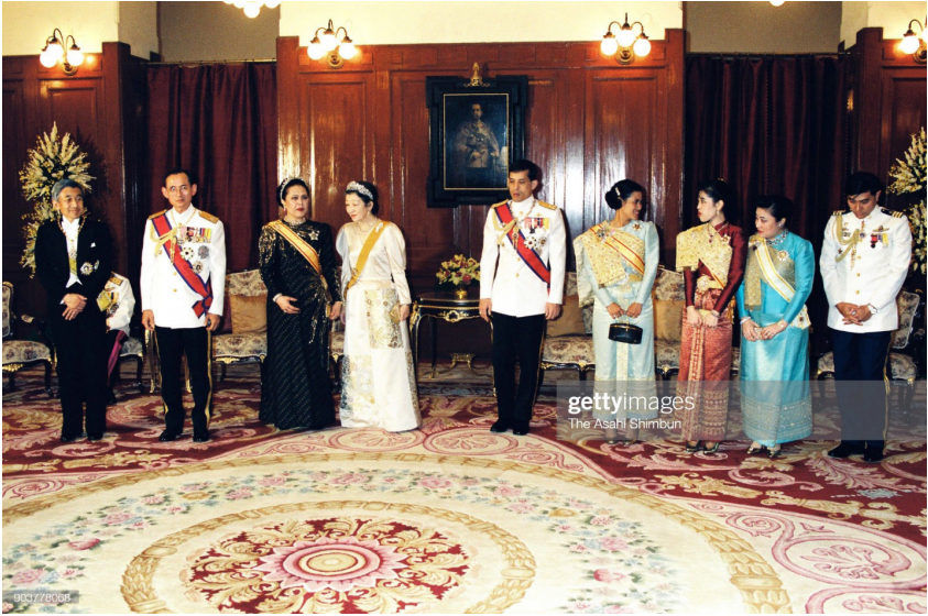
ภาพที่ 58 : สมเด็จพระจักรพรรดิอากิฮิโตะ และสมเด็จพระจักรพรรดินีมิจิโกะแห่งญี่ปุ่น ถวายพระกระยาหารค่ำอย่างเป็นทางการเป็นการตอบแทน (return banquet) แต่พระบาทสมเด็จพระบรมชนกาธิเบศร มหาภูมิพลอดุลยเดชมหาราช บรมนาถบพิตร และสมเด็จพระนางเจ้าสิริกิติ์ พระบรมราชินีนาถ พระบรมราชชนนีพันปีหลวง และพระบรมวงศานุวงศ์ ณ ศาลาสหทัยสมาคม ในพระบรมมหาราชวัง ในการนี้ สมเด็จพระนางเจ้าสิริกิติ์ พระบรมราชินีนาถ พระบรมราชชนนีพันปีหลวง และสมเด็จพระจักรพรรดินีมิจิโกะแห่งญี่ปุ่น ทรงฉลองพระองค์กระโปรงยาวแบบสากล ทรงเทียบตามธรรมเนียมสากล และประดับเครื่องราชอิสริยาภรณ์เต็มยศ สมเด็จพระกนิษฐาธิราชเจ้า กรมสมเด็จพระเทพรัตนราชสุดาฯ สยามบรมราชกุมารี และสมเด็จพระเจ้าฟ้าฯ กรมพระศรีสวางควัฒน วรขัตติยราชนารี ทรงฉลองพระองค์ไทยพระราชนิยมแบบไทยศิวาลัย พระเจ้าวรวงศ์เธอ พระองค์เจ้าโสมสวลี กรมหมื่นสุทธนารีนาถ ทรงฉลองพระองค์ไทยพระราชนิยมแบบไทยอมรินทร์พร้อมทั้งทรงสะพักกรองทอง

การเสด็จฯ เยือนประเทศไทยของพระประมุขแห่งรัฐพระองค์สำคัญในช่วงหลังสงครามเย็นเกิดขึ้นอีกครั้งในเดือนตุลาคม พ.ศ. 2539 สมเด็จพระราชินีนาถเอลิซาเบธที่ 2 พร้อมด้วยเจ้าชายฟิลิป ดยุกแห่งเอดินบะระ พระราชสวามี เสด็จฯ เยือนประเทศไทยอย่างเป็นทางการในฐานะพระราชอาคันตุกะของพระบาทสมเด็จพระบรมชนกาธิเบศร